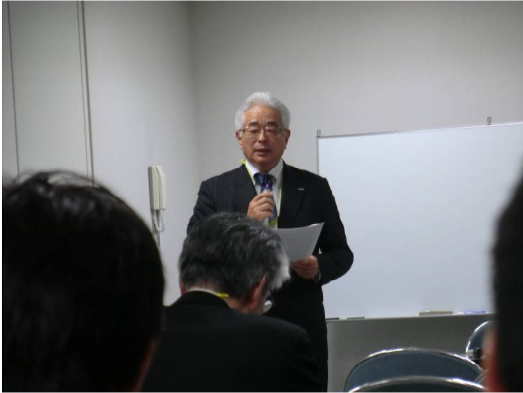
開会の挨拶(触媒学会 永原会長)