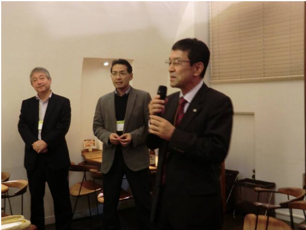
中締め (触媒学会 松久副会長: 前触媒工業協会副会長)